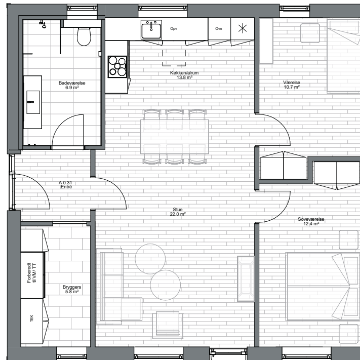
Boligtype A+B 1 1 : 50