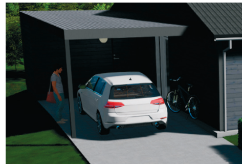
Tegningerne er vejledende