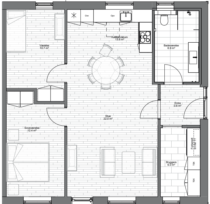
Boligtype A+B 2 1 : 50