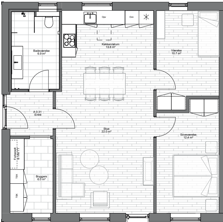
Boligtype A+B 1 1 : 50